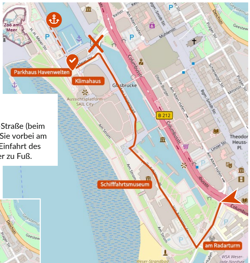
Bild: Karte zum Parkhaus Havenwelten

Fahren Sie von der Columbusstraße in die Van-Ronzelen-Straße (beim Radarturm). Eine ausgeschilderte Umleitungsrouten führt Sie vorbei am Deutschen Schifffahrtsmuseum und dem Klimahaus zur Einfahrt des Parkhauses Havenwelten. Von dort sind es ein paar Meter zu Fuß.